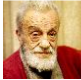
Necip Fazıl Kısakürek

Yokuşlar kaybolur çıkarız düze Kavuşuruz sonu gelmez gündüze Sapan taşların yanında füze Başka âlemlerle farkımız bizim